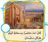
كان الله حاضرًا بسخانة فوق هيكل سليمان.